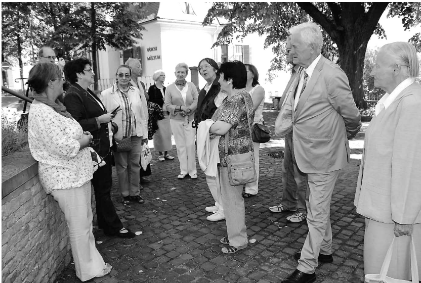
Séta idegenvezetővel a reformkori Füred belvárosában