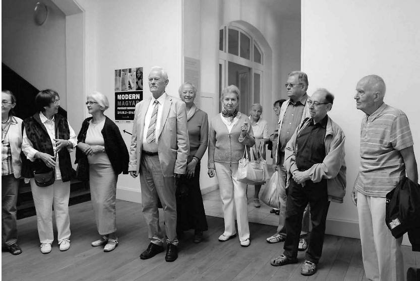
... akik nincsenek rajta az első képen