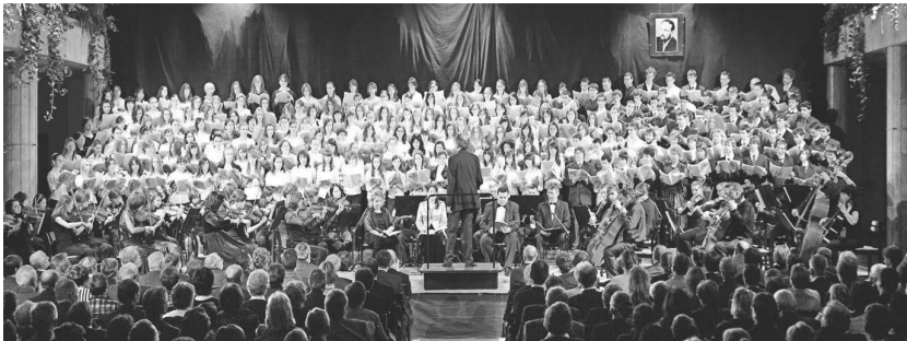
a veszprémi Középiskolai Oratóriumkórus

Több mint két évtizede hagyományosan január második szombatján rendezi a Brusznyai Alapítvány emlékhangversenyét az 1958. január 9-én ártatlanul kivégzett lovassys tanár emlékére.