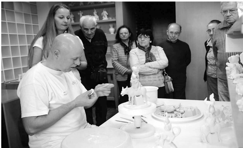
Munka közben a mester