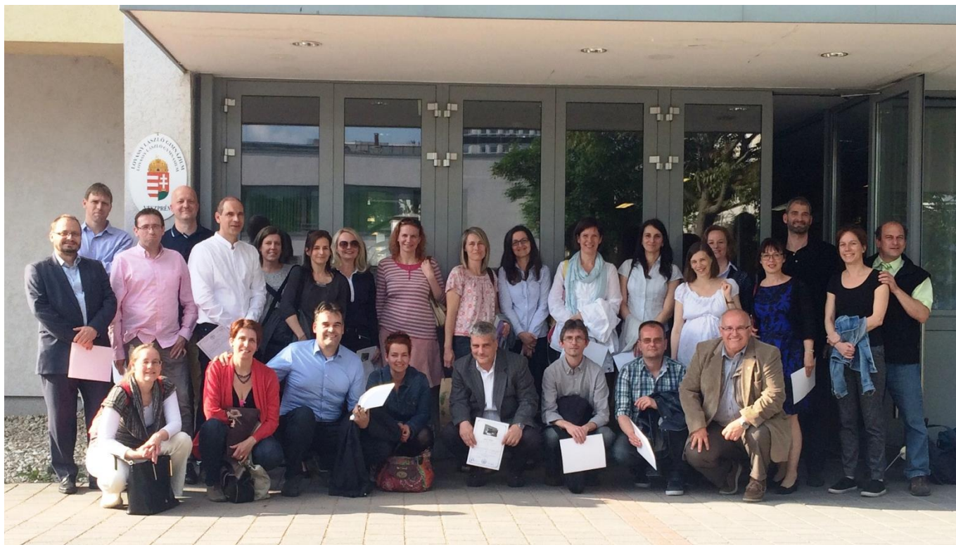
1991-ben végzett 4.C osztály