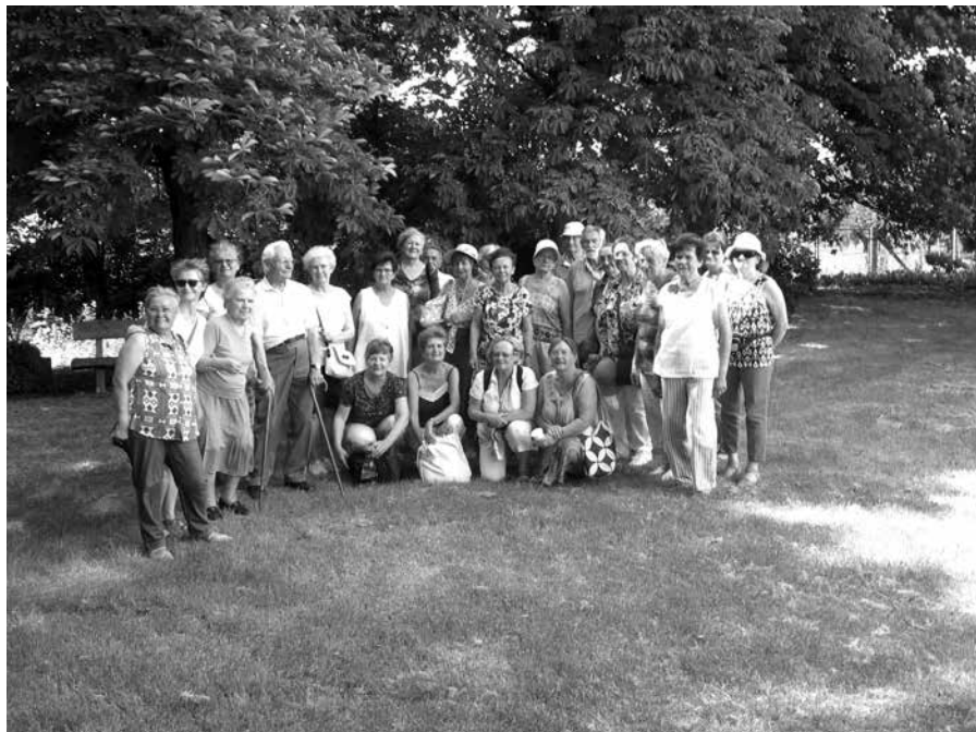
A vászolyi csapat

Megköszönve a vendéglátó Szönyeg család kedvességét, figyelmességét, Szönyeg János Vászolyról szóló monográfiájából közlünk egy rövid részletet.