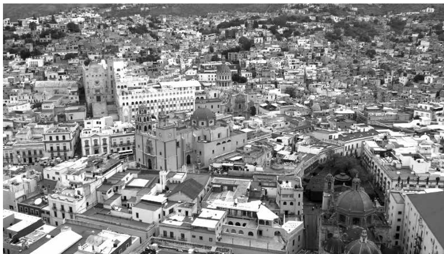
Guanajuato, az egyetemi város

Természetesen a fővárosban, Ciudad de Méxicóban, magyarul Mexikóvárosban is több ilyen park található. A közös Habsburg-magyar történelemből ismert, hogy I. Miksa néven császárként uralkodott Mexikóban Habsburg Miksa osztrák főherceg. 1867-ben egy felkelés következtében megfosztották trónjától és kivégezték. Négyévi uralkodása nyomait, tevékenységét őrzik az épületek, a parkok, melyeken az amerikai és a spanyol hatás is felfedezhető. Guanajuato, egyetemi város érdekessége a város alatt futó úthálózat, kereszteződésekkel, útelágazásokkal, ezzel tehermentesítve a történelmi városközpontot.