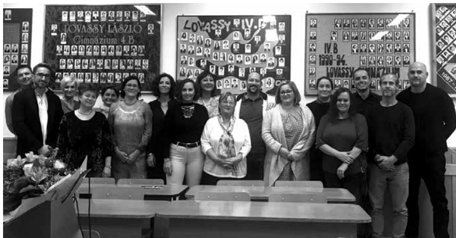
1994 - IV.B