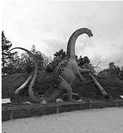
A népes „dino csapat” egyik tagja, az Apatosaurus

A veszprémi állatkert egyedi bemutatója a Dino park, mely inkább a gyermekek kedvelt helye, mivel valójában egy nagy játszótér. Néhány hatalmas őslény hátára fel lehet mászni, a homokban csontokat, lenyomatokat lehet „régészeti feltárással” találni.