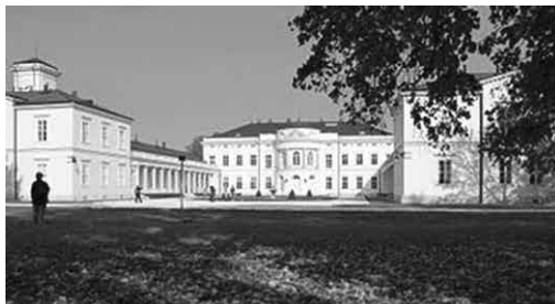
Fehérvárcsurgó, Károlyi- kastély

Bérelt busszal – lovassys sofőrrel –félnapos őszi kiránduláson vettünk részt.